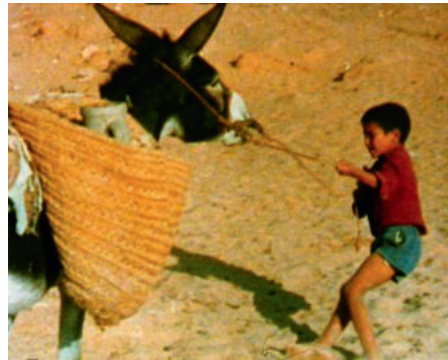
© Avoir vingt ans dans les Aurès de René Vautier (1971)