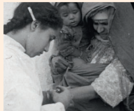
© Mission BCG au Sahara d'Albert Weber (1951)

du comité scientifique et d'éthique de la Cinémathèque de Bretagne.