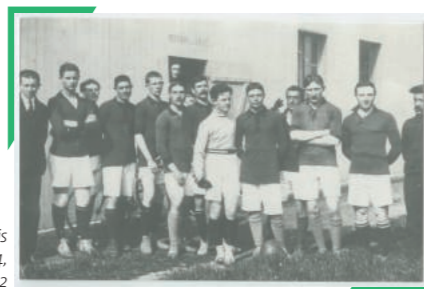
Joueurs de football du SRUC (Stade Rennais Université Club), Rennes, photographie, 1914, Arch. Dép. d'Ille-et-Vilaine, 6 Fi Rennes 912