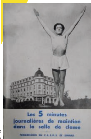
Brochure du CREPS, vers 1950 Arch. dép. d'Ille-et-Vilaine, 61 J 2