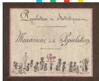
Détail, Population et statistique – Mouvement de la population : États, (1870-1888)