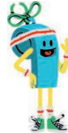
Illustration : Alexia Moutel