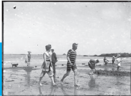
Bains de mer. Photographie, fin 19 e siècle-début 20 e siècle. Arch. dép. d'Ille-et-Vilaine, Fonds Nourry, 12 Fi 160.